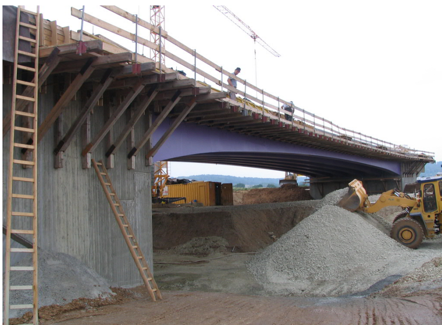
BW 48-2 Ansicht während der Widerlagerhinterfüllung

BW 48-2 Unterführung der St 2022 (neu) 52,2 m 11,5 m 601,45 m 2