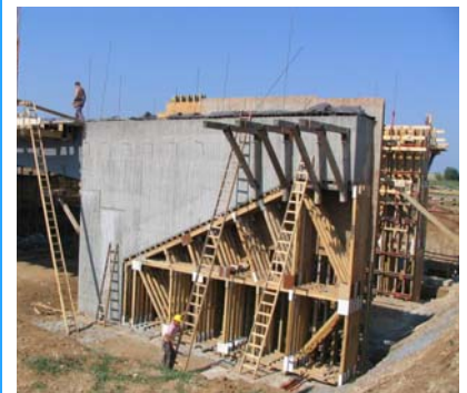
BW 48-2 Widerlager Nord BW 48-2 während der Ausschararbeiten, Flügel auf Traggerüst

Stahlverbundrahmen, Fertigteile aus Stahlverbundkästen und Ortbetonplatte in Mischbauweise