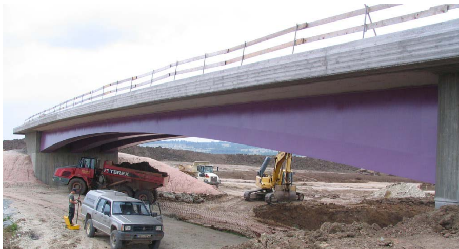
BW 47-1 während der nachfolgenden Streckenbauarbeiten

Abschnitt: Coburg (B4) – Ebersdorf b. Co. (B303) - Blatt 2 Stahlverbundbrücken